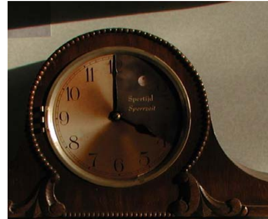
Markt 12 Aalten: Spertijd

objects and the power of their stories - marcel wouters 291