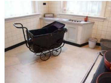
Markt 12 Aalten: De keuken

objects and the power of their stories - marcel wouters 293