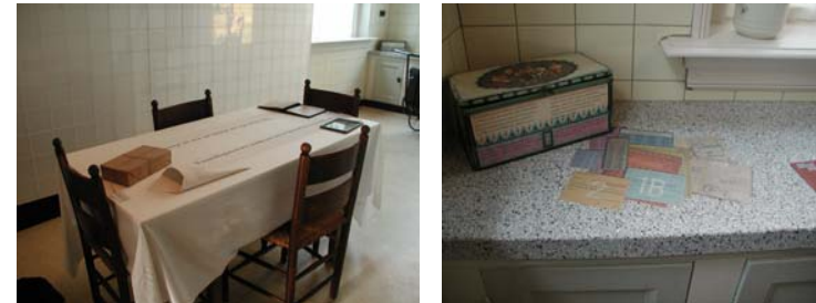
Markt 12 Aalten: De keuken

objects and the power of their stories - marcel wouters 292