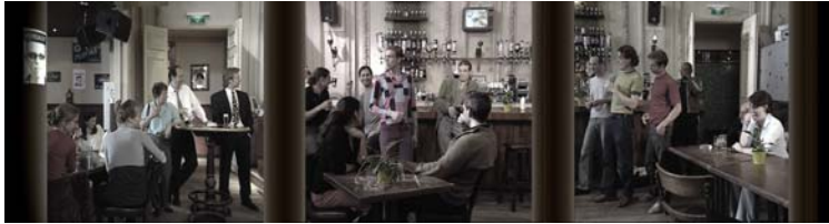
N.M. Kamp Vught: Cafésceen

sters, often on school outings, are the target audience. On the other hand, the museum should also be accessible to people who are somehow emotionally involved. And, of course, to people who wish to commemorate the Second World War.