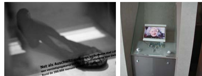
N.M. Kamp Vught: een object en een verhaal

objects and the power of their stories - marcel wouters 283