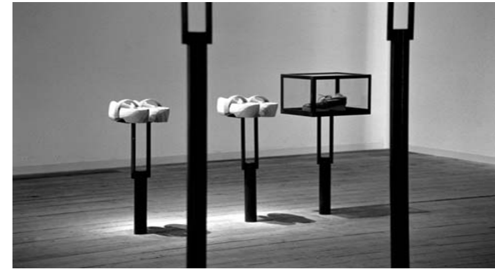
N.M. Kamp Vught: Zaal over het beroven van vrijheid

objects and the power of their stories - marcel wouters 284