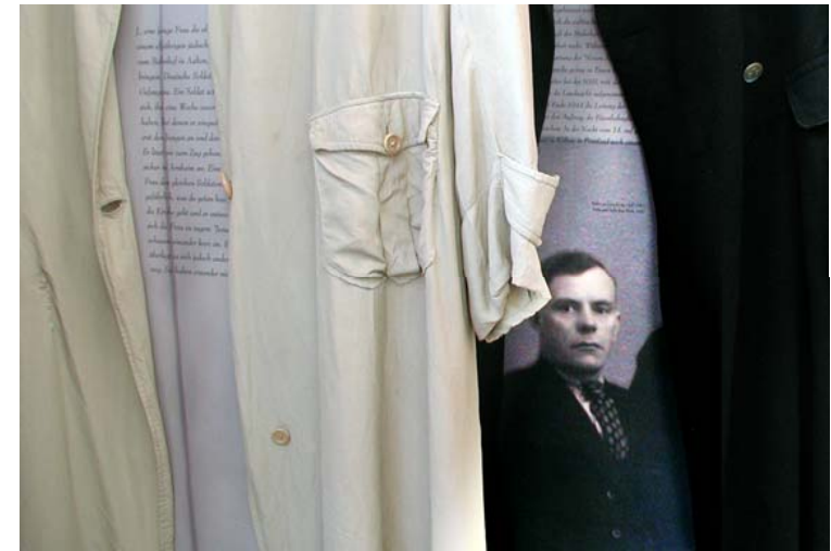
Markt 12 Aalten: Jassen in de gang

objects and the power of their stories - marcel wouters 290