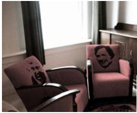
Markt 12 Aalten: ieder zijn eigen verhaal