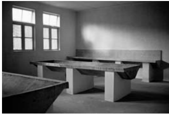
N.M. Kamp Vught: Barak

identity of the object contrasts sharply with the actual identity.