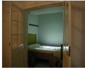
Markt 12 Aalten: Huiskamer en Scheveningerskamer

expect from a museum that has hideouts as its main theme?