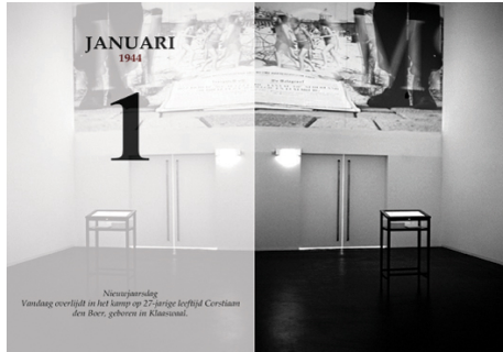
NM Kamp Vught: Introductieruimte

of emotional blackmail. Visitors might question the purpose of this mixture of conversations and newspaper reports. They might engage in a discussion, or it might urge them to think about it. The exhibition does not end in this area, it just leaves visitors with a clear message: always keep thinking and judging for yourself, even if it deviates from collective opinion or the law.