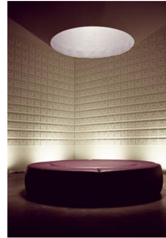
N.M. Kamp Vught: Bezinningsruimte

objects and the power of their stories - marcel wouters 287