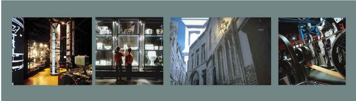
"Industrion", Museum voor industrie en samenleving, Kerkrade

Ook de middelgrote musea wilden meegaan in al deze ontwikkelingen. Maar de kosten van interactieve exhibits en ensceneringen waren daar echter te groot voor. Zeker voor toepassing in tijdelijke tentoonstellingen. Bovendien dreigde de inhoudelijke boodschap ondergeschikt te raken aan de grootse dominante vormgeving waarbij de bereikte effecten de overhand kregen. De ontwikkelingen waarin wij aanvankelijk voorop hadden gelopen dreigde nu, in een te krampachtige streven naar educatie en publiekparticipatie, door te schieten in hun succes.