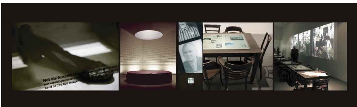
Nationaal Monument Kamp Vught, Vught

Presentaties die een diepere inhoudelijke ervaring bewerkstelligen. Daarbij worden bezoekers uitgenodigd tot discussie over het tentoongestelde. De persoonlijke tentoonstellingservaring, die mede afhankelijk is van de achtergrond van de individuele bezoeker, speelt daarbij een grote rol.