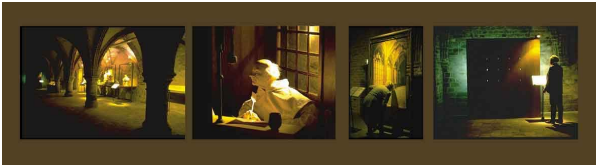
"Historama", een historische tentoonstelling in de abdij van Middelburg.

Wij werden gevraagd om in een oude abdij de geschiedenis van deze abdij weer te geven door aan de wand foto's en grote, goed leesbare, teksten aan te brengen. Aangeleverd werd een heel boek vol teksten waarvan wij dachten dat ze niet gelezen zou worden. Het leek ons het beste om de teksten los te maken van de afbeeldingen en te behandelen als een boek dat telkens op een andere bladzijde openligt. Om de kwaliteit van de abdij niet te verstoren hebben wij gekozen voor moderne materialen die toch iets te maken hebben met de oude abdij: gobelinachtige doeken met houten knoppen, dikke houten platen aan kettingen en gezeefdrukte teksten die aangebracht lijken op perkament.