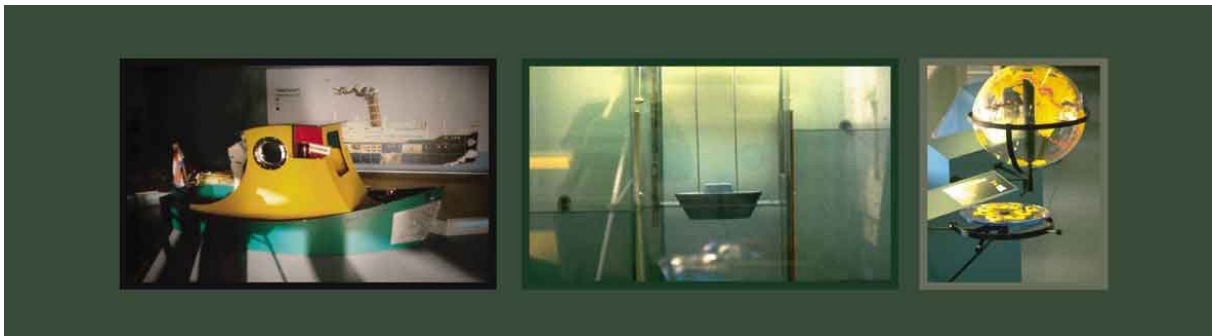
"Professor Plons", interactieve kindertentoonstelling over maritieme basis principes.

opstellingen geven je de gelegenheid om ontdekkingen te doen. Daarom beschrijven ze niet al te precies wat de ontdekking zou moeten zijn. Daar waar uitleg nodig is, is deze kort, simpel en zo duidelijk mogelijk.