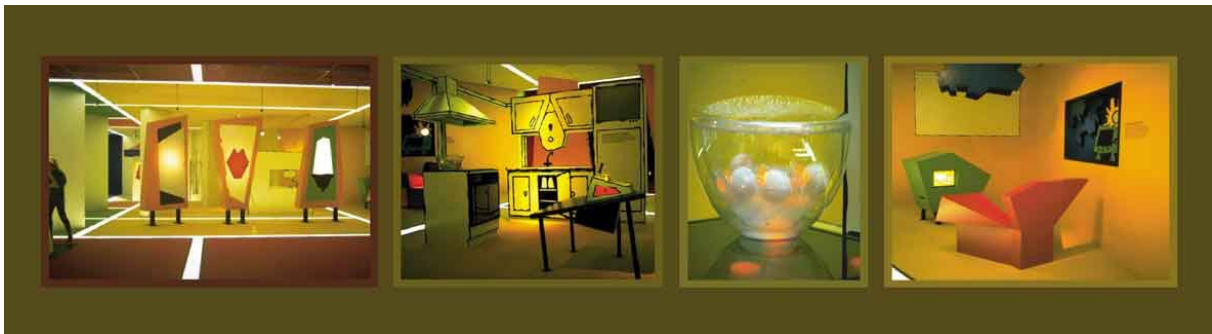
"Milieu op de Korrel", Tilburg

vrolijk en op een manier die het absoluut onmogelijk maakt om passief even een snelle blik te werpen. Het onderwerp lijkt in eerste instantie misschien saai, maar wat ermee gedaan is, is ánders!"