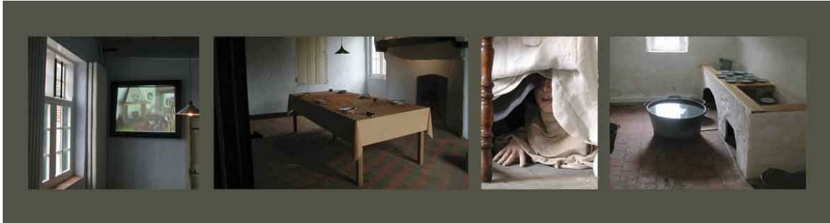
Bezoekerscentrum "de Huysmanshoeve", Eeklo België

Ook de overheid en de Nederlandse Museumvereniging beraadden zich over de toekomst van de musea. De overheid streefde aanvankelijk naar een hoger rendement van de in de musea aanwezige collecties. Het idee daarachter was dat de meer dan duizend Nederlandse musea samen eigenlijk één grote collectie beheren. Ze lanceerde het begrip: Collectie Nederland. Dit plan zou een onbeperkte uitwisseling moeten betekenen tussen de verschillende musea. Het resultaat was echter dat musea meer als tevoren hun collectie vasthielden om hun bestaansrecht en uniciteit te garanderen.